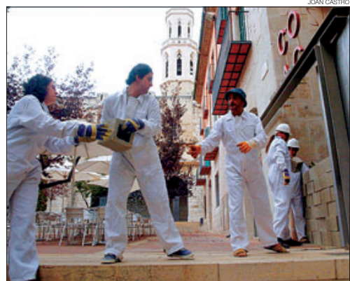
► Membres del col·lectiu Salvem l'Empordà tapijen la porta, ahir.

L'acció d'ahir forma part d'una campanya de Salvem l'Empordà per millorar el document aprovat inicialment pel Govern. Consideren que les infraestructures ferroviàries i viàries previstes estan sobredimensionades. ≡